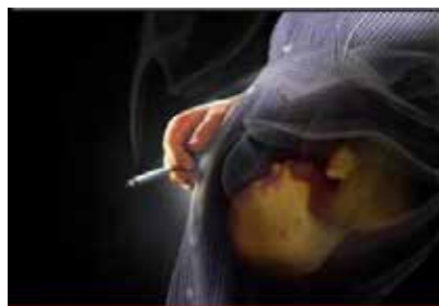
Passive smoking affects fetus and leads to growth retardation and premature labor