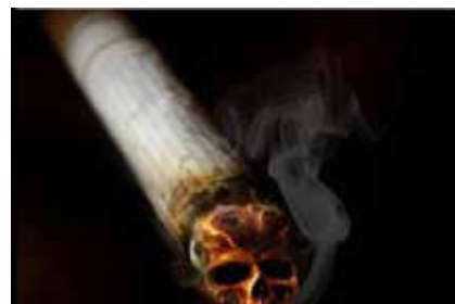
Smoking causes early death