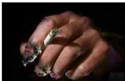
Smoking increases risk of more than 25 diseases including cancer and cardiovascular disease