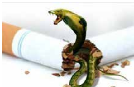
Cigarettes contain more than 4000 toxic substances and causes death